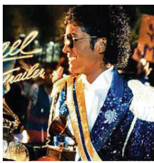
చూపించనున్నారు. ఏప్రిల్ 24న ప్రపంచవ్యాప్తంగా ఈ చిత్రం రిలీజ్ చేయబడతే రానుంది. ఈ చిత్రం పవర్ రేన్జర్స్ రూ. 10 లక్షల కోట్లు రాబట్టవచ్చని ఇండస్ట్రీలో టాక్ ఉంది.